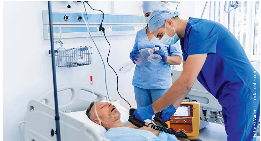
Mit einem Defibrillator rettet ein Arzt das Leben eines älteren Patienten.