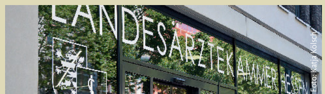
Das neue Gebäude der Landesärztekammer Hessen an der Hanauer Landstraße 152 in 60314 Frankfurt/Main.