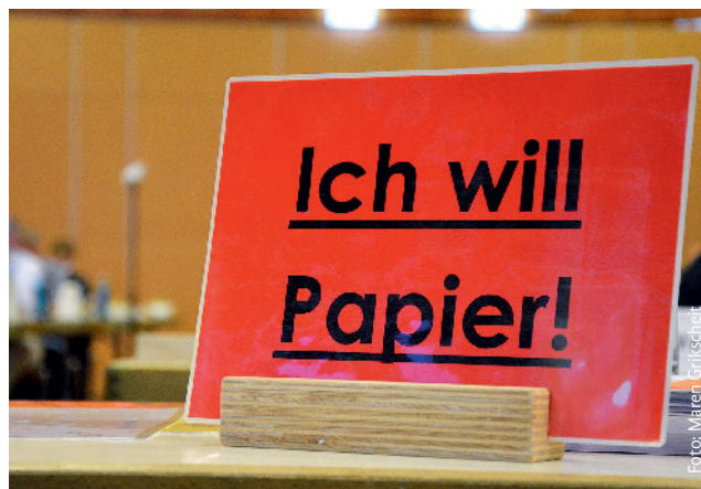
Impression am Rande: Nicht immer geht alles digital.

Zum Hintergrund: Die Kenntnisstandprüfungen zur Erlangung der Berufserlaubnis als Ärztin oder Arzt in Hessen bei Ausbildungsabschluss im Ausland werden im